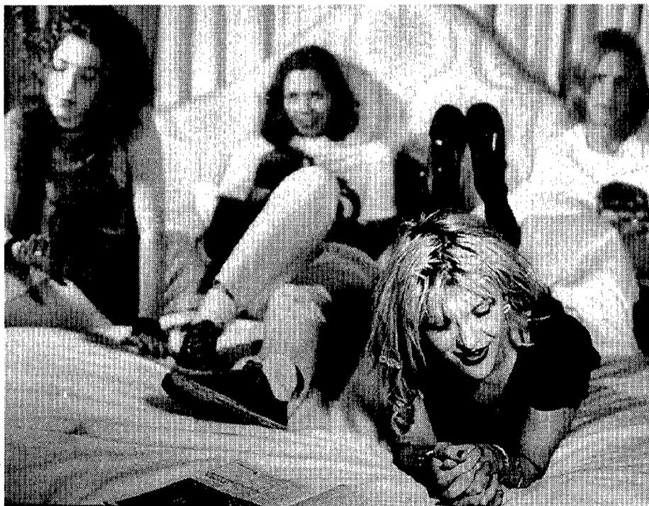
Courtney Love, la última viuda del rock, canta y corta el bacalao en Hole

Club Correcomins 4 x 4. Inscripciones hasta el 4 de abril. ☎ 751-55-98