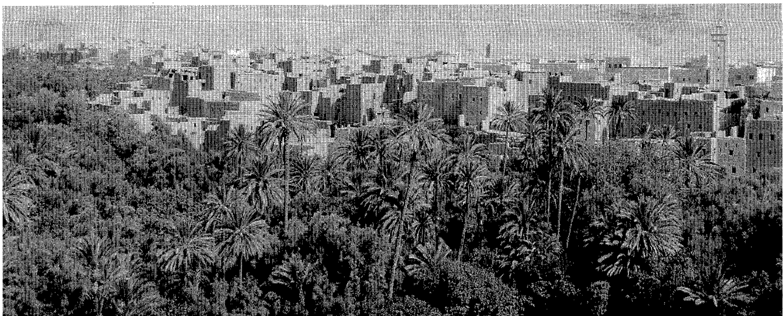
Un paseo por el desierto magrebí en 4x4 para las vacaciones de la Semana Santa que se avecina